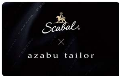
<コラボレーションカード>