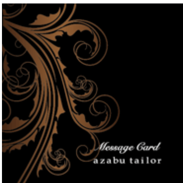
<ラッピングイメージ>