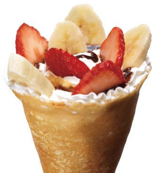
商品イメージ画像

株式会社バリューデザイン(以下、バリューデザイン)は、とろけるクレープが女性に人気の株式会社モミアンドトイ・エンターテイメント(以下、モミアンドトイ)に電子マネー発行システムを提供します。カードデザインは、女性が持っていてうれしくなるようなデザインにしました。