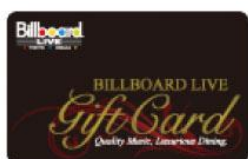
Billboard LIVE Gift Card 株式会社阪神コンテンツリンク