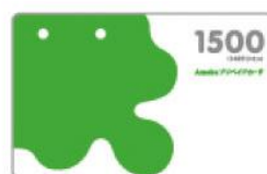
Ameba プリペイドカード 株式会社サイバーエージェント