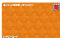
ハッピーカード 株式会社新生堂薬局