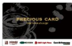
PRECIOUS CARD ユーシーシーフードサービスシステムズ株式会社