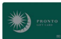
PRONTO CARD 株式会社プロントコーポレーション