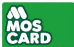
MOS CARD 株式会社モスフードサービス