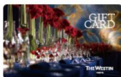
THE WESTIN TOKYO Gift Card 株式会社三田ホールディング