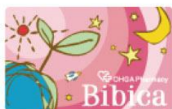
Bibica 株式会社大賀薬局