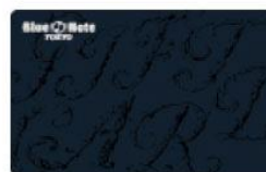
BLUE NOTE TOKYO Gift Card 株式会社ブルーノートジャパン