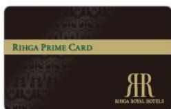
RIHGA PRIME CARD&GIFT 株式会社ロイヤルホテル