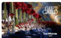
THE WESTIN TOKYO Gift Card