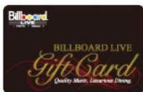
Billboard LIVE Gift Card