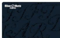
BLUE NOTE TOKYO Gift Card