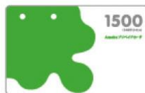
Ameba プリペイドカード