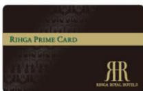
RIHGA PRIME CARD&GIFT