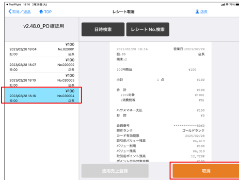
▼POSアプリ>レシート取消画面