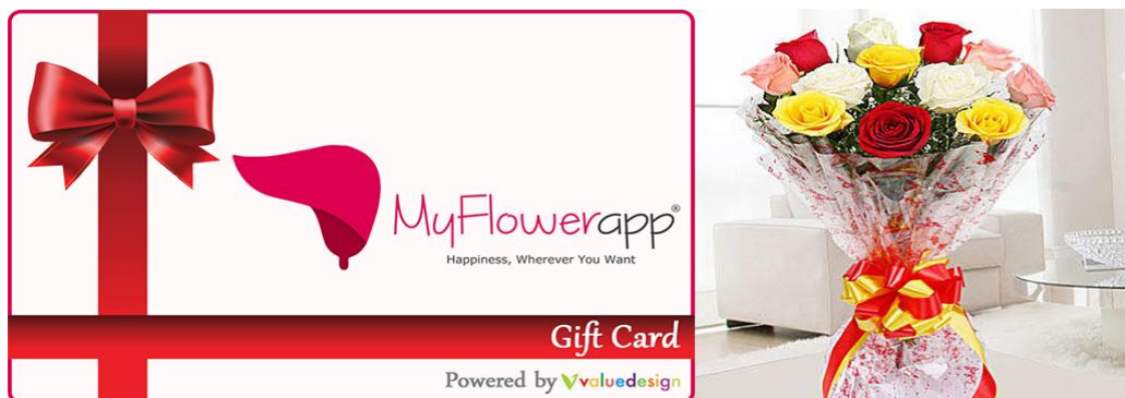
※「MyFlowerapp」ギフトカードイメージ

本連携によりバリューデザインは、インド国内約 3 億人の消費者にアプローチ可能なディストリビューター 6 社を介した流通ネットワークに紐づくギフトカード提供パートナーとして、MyFlowerapp.com のフラワーギフトをラインナップに追加し、ネットワークの拡充を図ります。